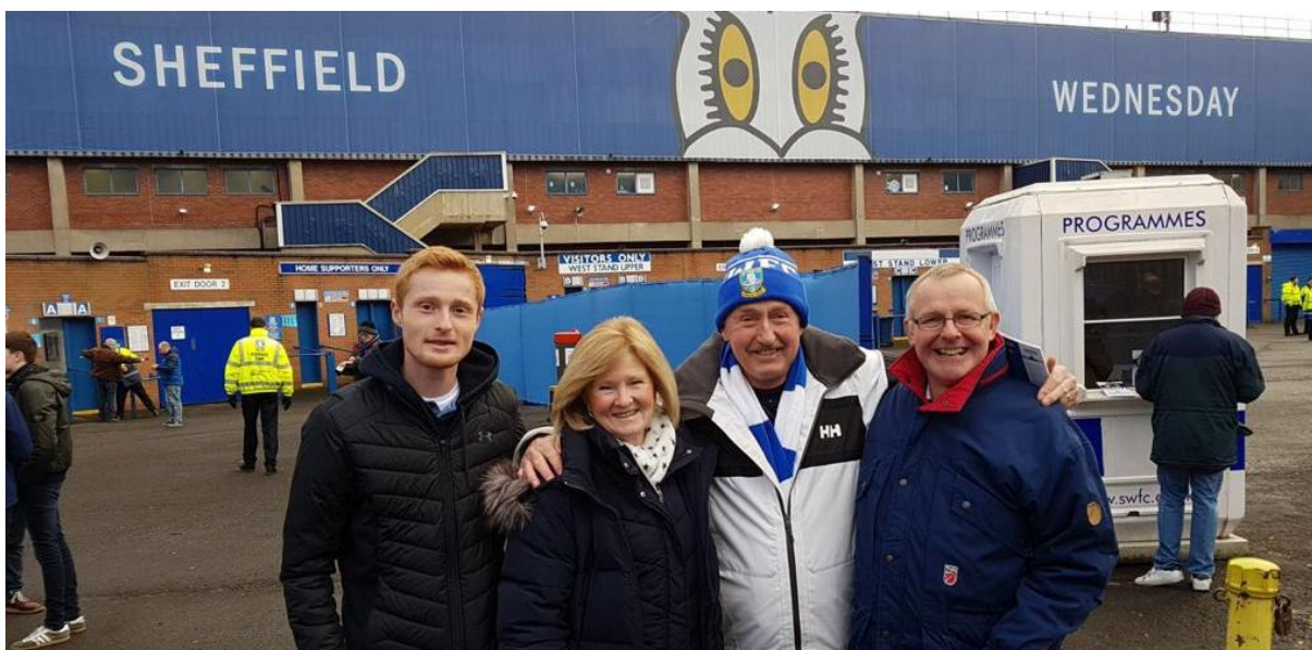
Den fotball interesserte delen av familien samlet foran Sheffield's hjemme stadion.